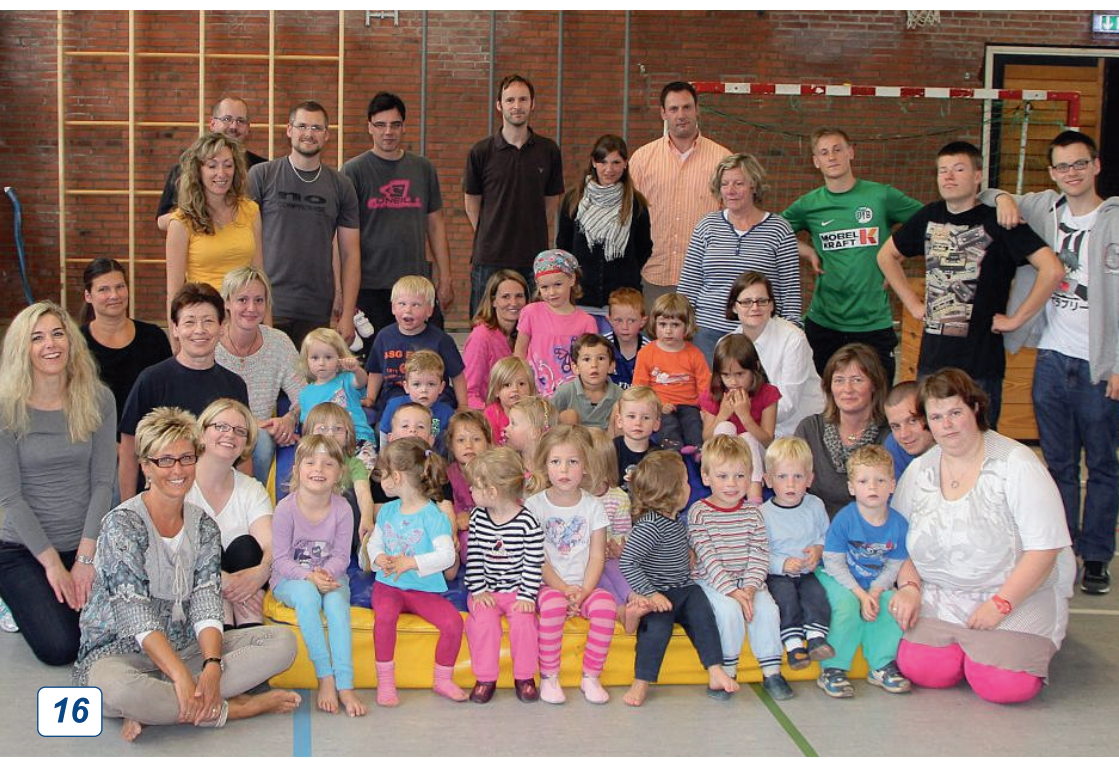
Kinderturngruppe 2 (unten)