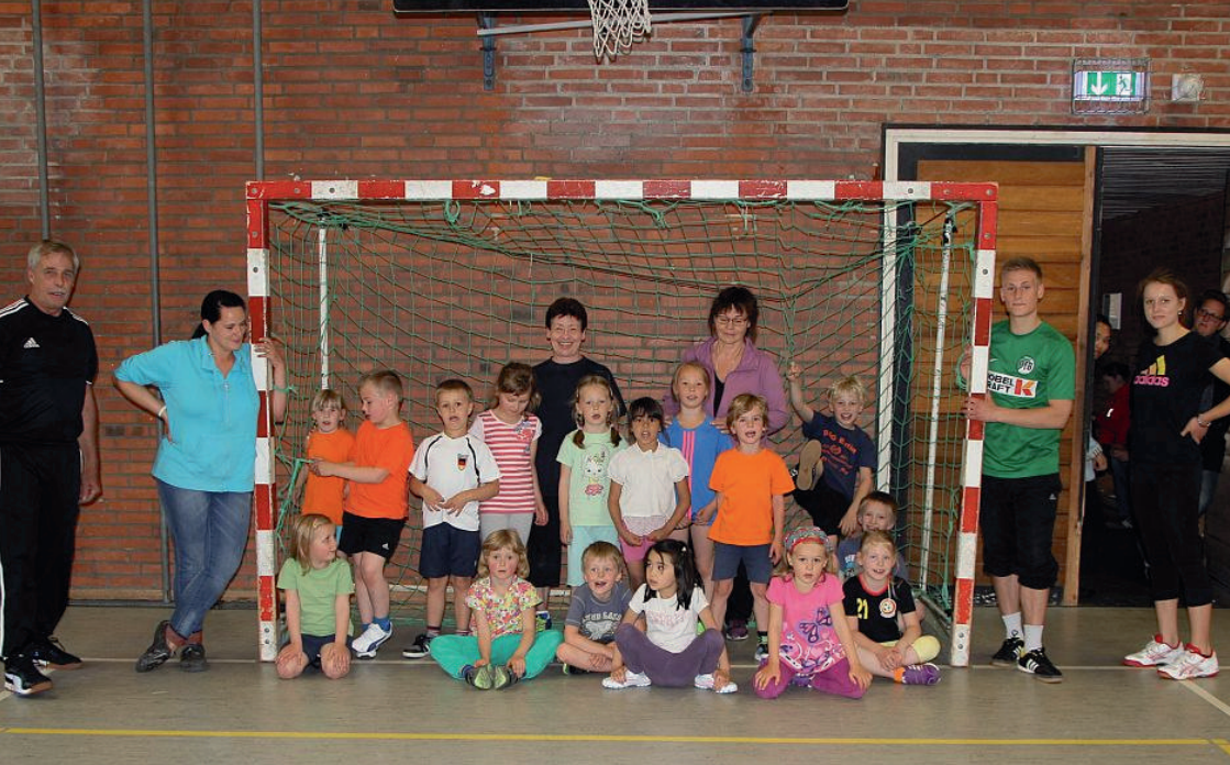
Kinderturngruppe 1 (oben)