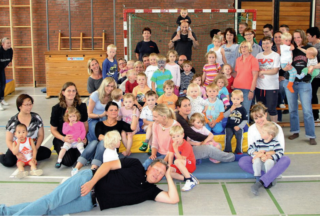
Kinderturngruppe 3 (oben)