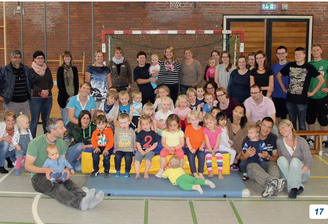
Kinderturngruppe 4 (unten)