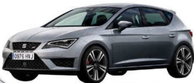
SEAT Leon Cupra