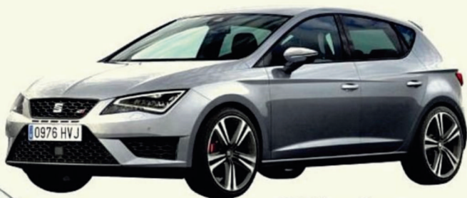
SEAT Leon Cupra